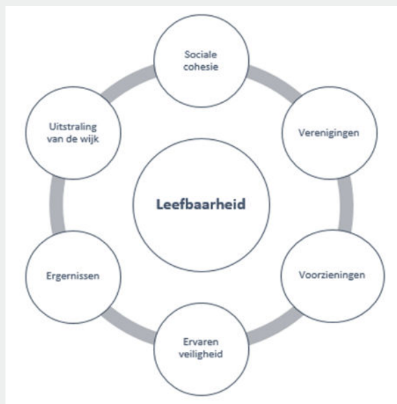
Figuur 2. Factoren die invloed hebben op leefbaarheid in Sanderbout

“Leefbaarheid is vooral veel plezier met elkaar te kunnen hebben, door met elkaar te kunnen praten. Geen geruzie in de wijk. Met elkaar met respect kunnen communiceren. Iets kunnen organiseren. Dat is een praatje maken op straat en genieten van andere mensen en de kinderen van anderen en samen genieten van de dagelijkse dingen.”